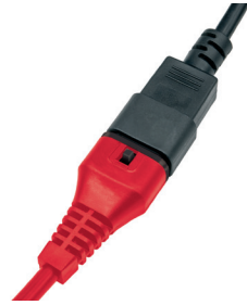
Steckbares Netzkabel und integrierte Kabellicherung.