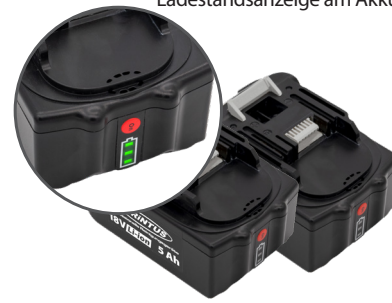
2 x 18 V Li-ion, 5 Ah Akkus. Art.-Nr. 119.121 (einzeln)