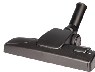
Kombidüse 280 mm Art.-Nr. 114.114