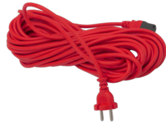
15 m steckbares Netzkabel. Art.-Nr. 119.119