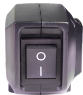
Powerknopf einfach zu erreichen.