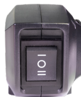
ECO-Modus bei der Akkuversion.