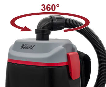
360° Drehgelenk, grenzenlose Beweglichkeit.