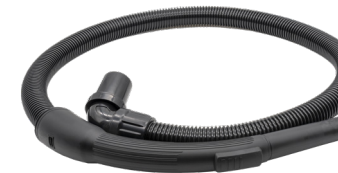
1,3 m Saugschlauch. Art.-Nr. 119.124