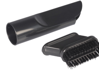
2in1 Fugen- / Polsterdüse. Art.-Nr. 115.127