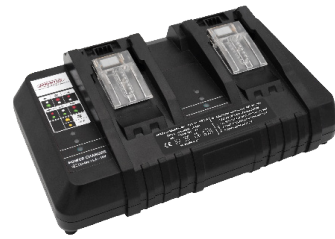
Doppel-Schnellladegerät. Art.-Nr. 119.120