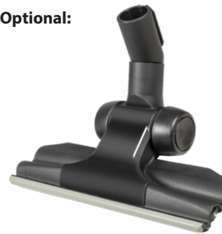
Flachbodendüse 280 mm Art.-Nr. 119.126