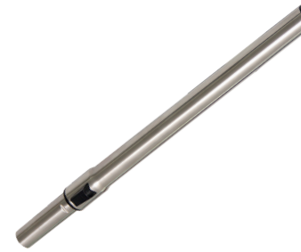
Edelstahl Teleskoprohr 0,6 – 1,0 m. Art.-Nr. 111.133